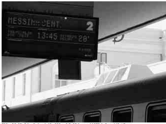
TRENI DEI PENDOLARI QUASI SEMPRE IN RITARDO: UNA SORTE CHE UNISCE L'ITALIA